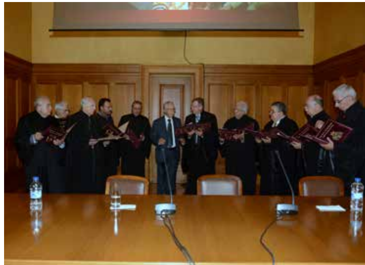
Μέλη του "εν Αθήναις Συλλόγου Μουσικοφίλων Κωνσταντινουπόλεως" ψάλλουν τον Πολυχρονισμό του Οικουμενικού Πατριάρχη και Εκκλησιαστικούς Ύμνους.

Τα παραπάνω αποτελούν μόνο μια σύντομη περιγραφή των δραστηριοτήτων της ΟΙ.ΟΜ.ΚΩ. Για περισσότερες πληροφορίες παρακαλούμε να αποταθείτε στην ιστοσελίδα: www.conpolis.eu .